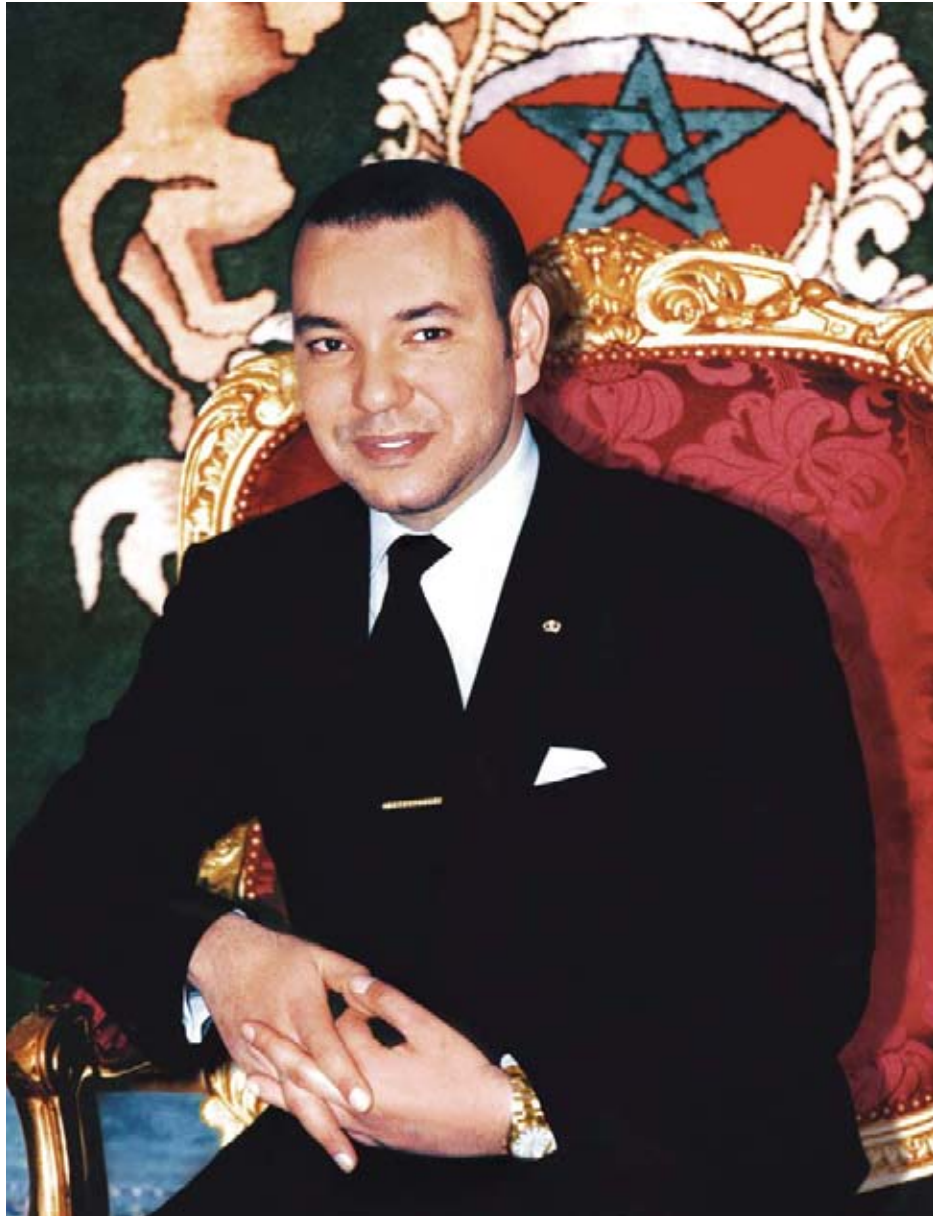
SA MAJESTE LE ROI MOHAMMED VI QUE DIEU L'ASSISTE